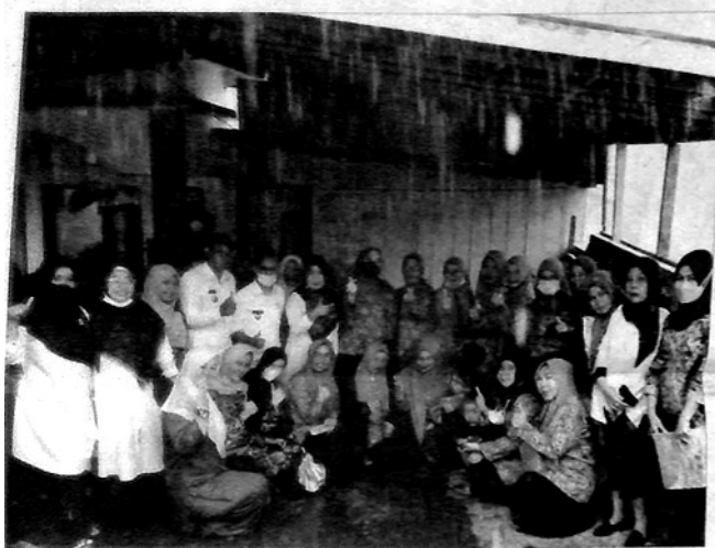
TIM Penilai Dasawisma saat melakukan kunjungan ke salah satu dasawisma.