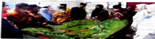
INOVASI: Salah satu karya santri Perguruan Diniyyah Puteri Padangpanjang.

BERUSAHA 30 tahun, Perguruan Diniyyah Puteri Padangpanjang yang menilikinya pendidikan melalui dari lingkungan sosial (TK) hingga perguruan tinggi (STIT) terus memajukan kualitas kependidikan sebagai lembaga pendidikan berkarakteristik sebagai institusi pendidikan yang unggul.